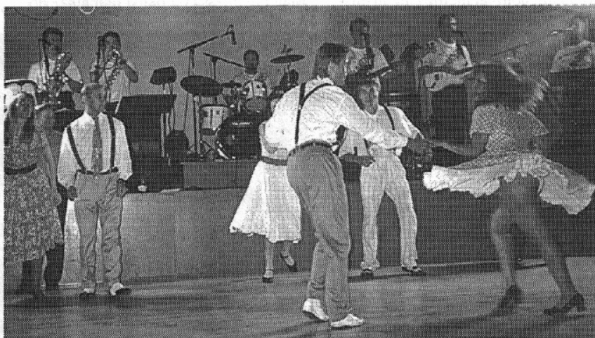
Finlanders ja Comets vauhdissa

Olemme mielenkiinnolla seuranneet myös jenkkitanssien, etunenässä tietenkin boogie-woogien, suosion huimaa kasvua ja leviämistä myös pääkaupunkiseudun ulkopuolelle (...jopa Turkuun).