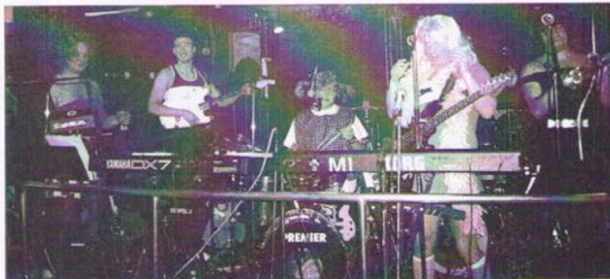
Naisten sarjan kolmas sija: Spicelanders, rummuissa Peppi Pitkäreppi