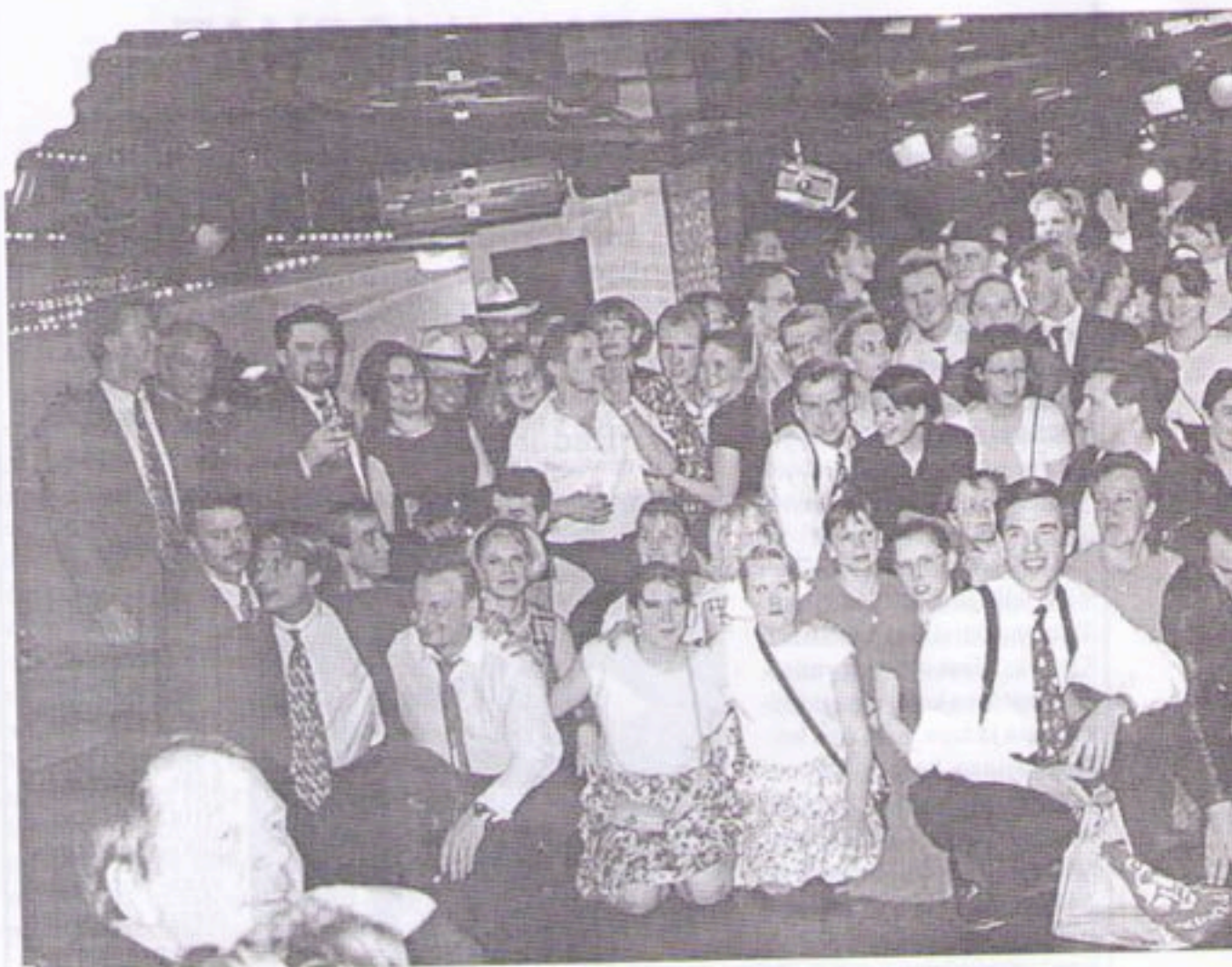
Hilpeä Boogie-Woogarijoukko kokoontuneena yhteiskuvaan intensiivisen illan ja iltapäivän jälkeen.

B oogie Woogien ystävät Suomen Turuust', ja vähän muu altakin, halusivat järjestää tanssiristeilyn jolta he odottivat reipasta menoa ja meininkiä 50-luvun tyyliin. Heidän toiveenaan oli saada Finlanders vauhdittamaan yhteistä yhteistä ajanviettoa. Katsaus laivayhtiöiden ohjelmaan josta löytyikin sopivainen päivä: 12.12.1997 ja eipä muuta kuin tekemään varaus 120:lle hengelle. Viidakkorumpu pauhaamaan ja niinpä neljässä päivässä nuo paikat