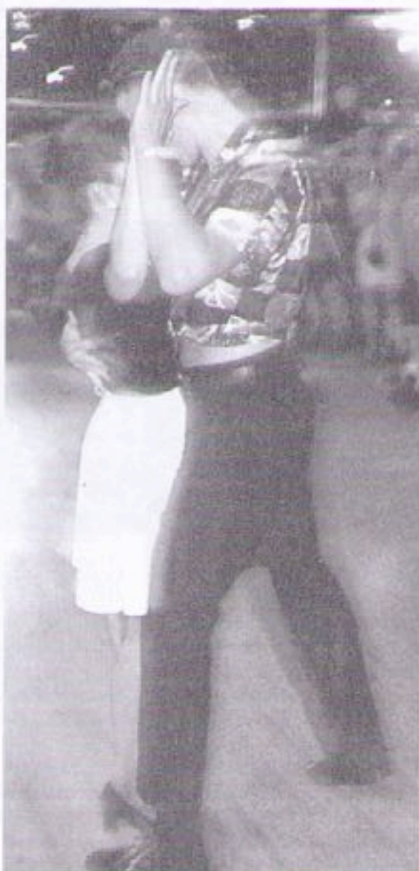
Sannat ovat tarpeettomia kun kehot keskustelevat kujeillen.

loilijoita" on enemmän kuin yksi mies ja mikki. Aina uudestaan samat ihmiset kokoontuvat poikien keikalle, se kuvastaa kiitosta, arvostusta ja tyytyväisyyttä. Heille tanssijat ovat myös konkreettisesti yhteistyökumppaneita.