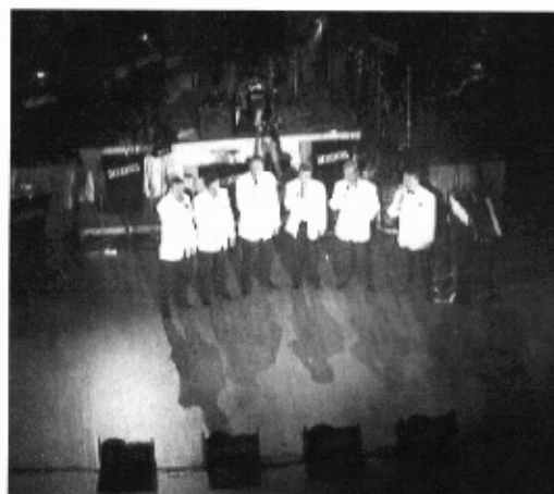
Finlanders: "Romanssi" elokuvasta Katariina ja Munkkiniemen kaunis kreivi.